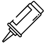
Produits à base de silicone